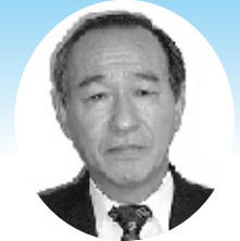
中小企業診断協会兵庫県支部 副支部長