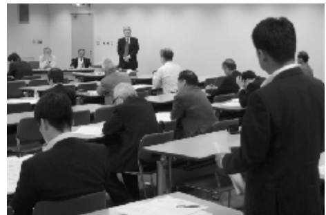
活発な質疑応答が行われた