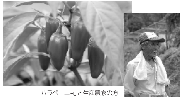
「ハラペーニョ」と生産農家の方

また、補完的に地域の情報発信として「ふるさと通信」や都会の方がふるさとに訪問する「ただいま交流会」、マスコミリリースなど啓蒙活動も積極的に取り組んで維持拡大に努めております( http://www.shinofarm.jp/furusato.htm )。この取り組みは大阪商工会議所・大阪NPOセンター主催のCB(コミュニティビジネス)・CSO(市民社会組織)おおさかアワード2009で栄誉ある大賞を受賞し、審査委員長より、新しいソーシャルビジネスで実現性の高いビジネスモデルとして高い評価を頂きました( http://www.osakanpo-center.com/cso/oubo.html )。