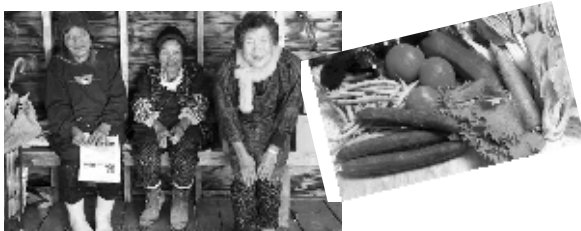
「ふるさと野菜のおすそ分け」事業に協力してくれているお年寄りと野菜

全国7,800ヶ所(京都府140ヶ所)あると言われている限界集落(65歳以上の方が集落の半数以上を占めている)活性化の一環として「ふるさと野菜のおすそ分け」事業を企画し、行政の協力を頂き活動しております。本事業は、農村地域の高齢者(65歳以上)の方を対象に、ややもすると食べきれず土に返されている「自家消費の農産物」を、都会の消費者に定期的に手紙付きで送る「ふるさと野菜のおすそ分け」という事業です。これによって、心の交流や人的交流が生まれ、地産地消・食育・安心安全・ふるさとづくりなどを通じて、最終的には地域の活性化に繋がっていきたく考えております。