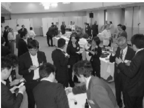
懇親会で親睦を深める参加者

懇親会には、兵庫県、(公財)ひょうご産業活性化センター、(公財)神戸市産業振興財団、(独)中小企業基盤整備機構近畿支部、兵庫県商工会連合会、兵庫県中小企業団体中央会、兵庫県中小企業再生支援協議会、神戸商工会議所、日本政策金融公庫神戸支店、商工組合中央金庫神戸支店、近畿税理士会神戸支部などより多数のご来賓の参会を賜り、またそれぞれの代表の方より、我が支部の中小企業に対する経営支援活動について期待と叱咤激励のお言葉をいただきました。参会した支部会員は、ご来賓の方々との対話を通じ交流を深めさせていただくとともに、和やかなひとときを過ごしていました。