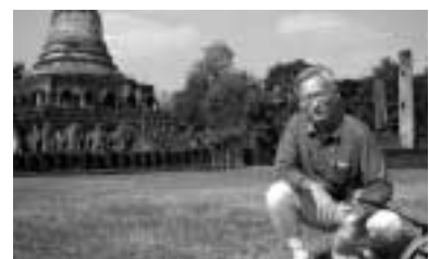
▲ワット・チャーン・ロームの前の筆者

日本と全く違う気候、食べ物や果物、歴史との出会い、タイの人々との交流。すべてが私にとっては貴重な思い出だ。それらについても書きたかったのだが紙幅がない。最後にひとこと。日本の経済は勢いを失っているが、タイの経済には明るい未来がある。