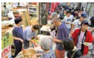
イベントで賑わう商店街

去る2月27日(水)神戸市産業振興センターにおいて、平成30年度に実施した調査研究事業の報告会が開催されました。今回のテーマは「地域経済の自立的循環に資する地域商業活性化について～空き店舗問題に内包される地域商業が抱える課題と対策～」というものです。メンバー全員