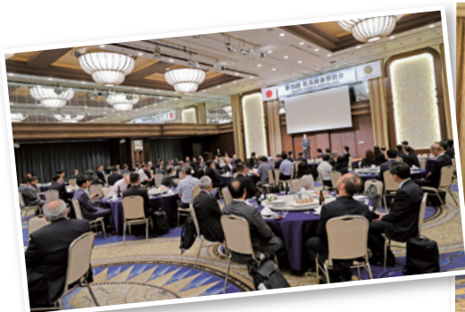
懇親会では協会会員の皆さま、 ご来賓の皆さまに多数出席いただきました

また、懇親会では独立行政法人中小企業基盤整備機構、公益財団法人ひょうご産業活性化センター、公益財団法人神戸市産業振興財団をはじめ、多数のご来賓にご参加いただき、各団体との親交を深めることができました。